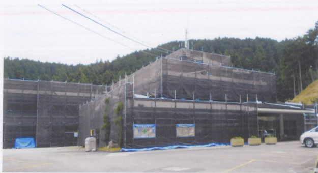
本館が足場に囲われました。